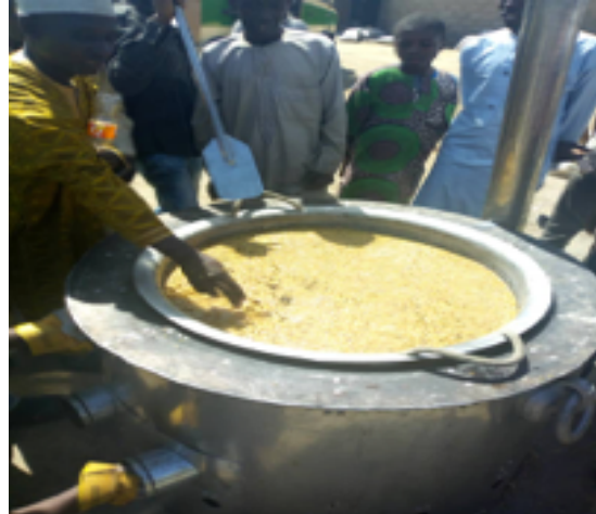
Een idee van de grote AGE-PANDA-cookers.