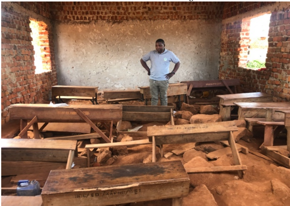
Bij een schoolbezoek in de regio waar EECP actief is, troffen we dit klaslokaal aan in een door de Staat ondersteunde school.