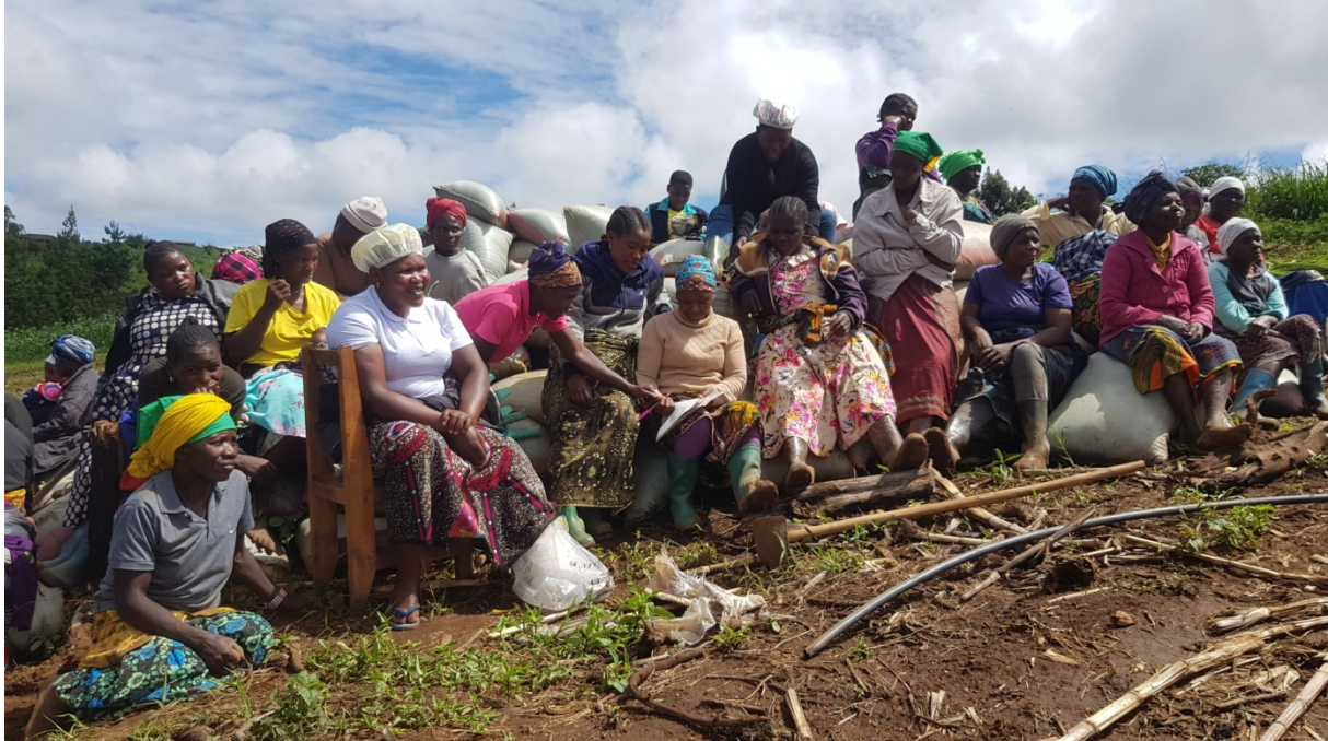
Wawawe women group of Njombe

WakK and PUM will investigate the processing equipment (oil extraction) of avocados and sunflower (appropriate grinding mills and soap production).