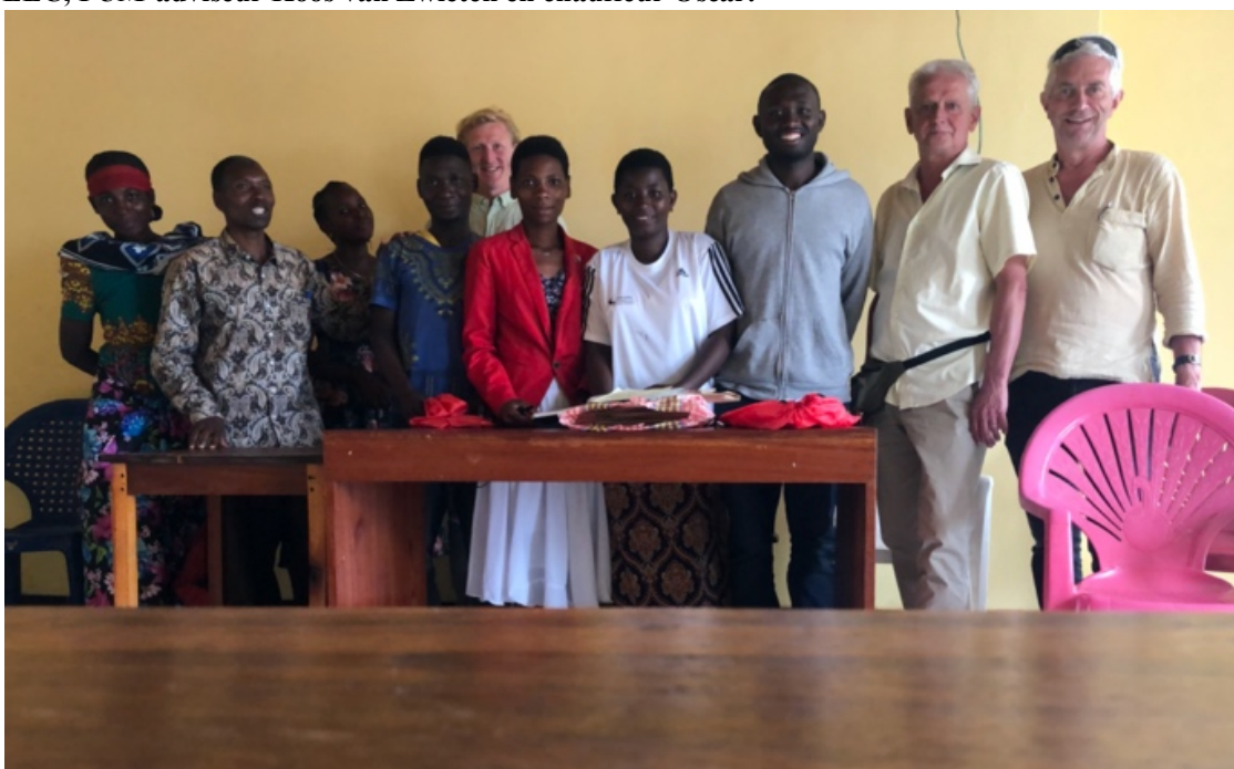
De Nederlandse afvaardiging met het WEGBO-bestuur tijdens een algemene vergadering resp. onderlinge kennismaking.